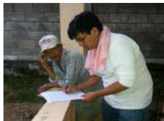
Estudiantes de la carrera de Pedagogía durante el levantamiento de la línea base, identificar el nivel de analfabetismo del municipio.

Luis y San José, donde se aplicaron encuestas para identificar el grado de analfabetismo que se registra en las referidas comunidades.