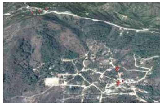
Figura 1. Fotografía Satelital del municipio de San Marcos de Sierra con la ubicación de los Pozos.

Actualmente se está trabajando en el acompañamiento para obtener recursos financieros para la ejecución física del diseño para que el pueblo de San Marcos de la Sierra pueda tener su sistema de agua potable para la comunidad que tanto lo necesita. Asimismo, el DIM está planificando otros proyectos para el apoyo a las comunidades como ser proyectos de diseño de electrificación, generación energía eléctrica por medio de celdas fotovoltaicas para zonas muy alejadas a una línea primaria de la ENEE.