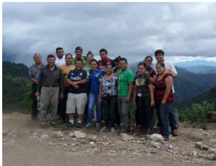
San Marcos de Sierra es uno de los municipios priorizados por la UNAH para mejorar el Índice de Desarrollo Humano (IDH).