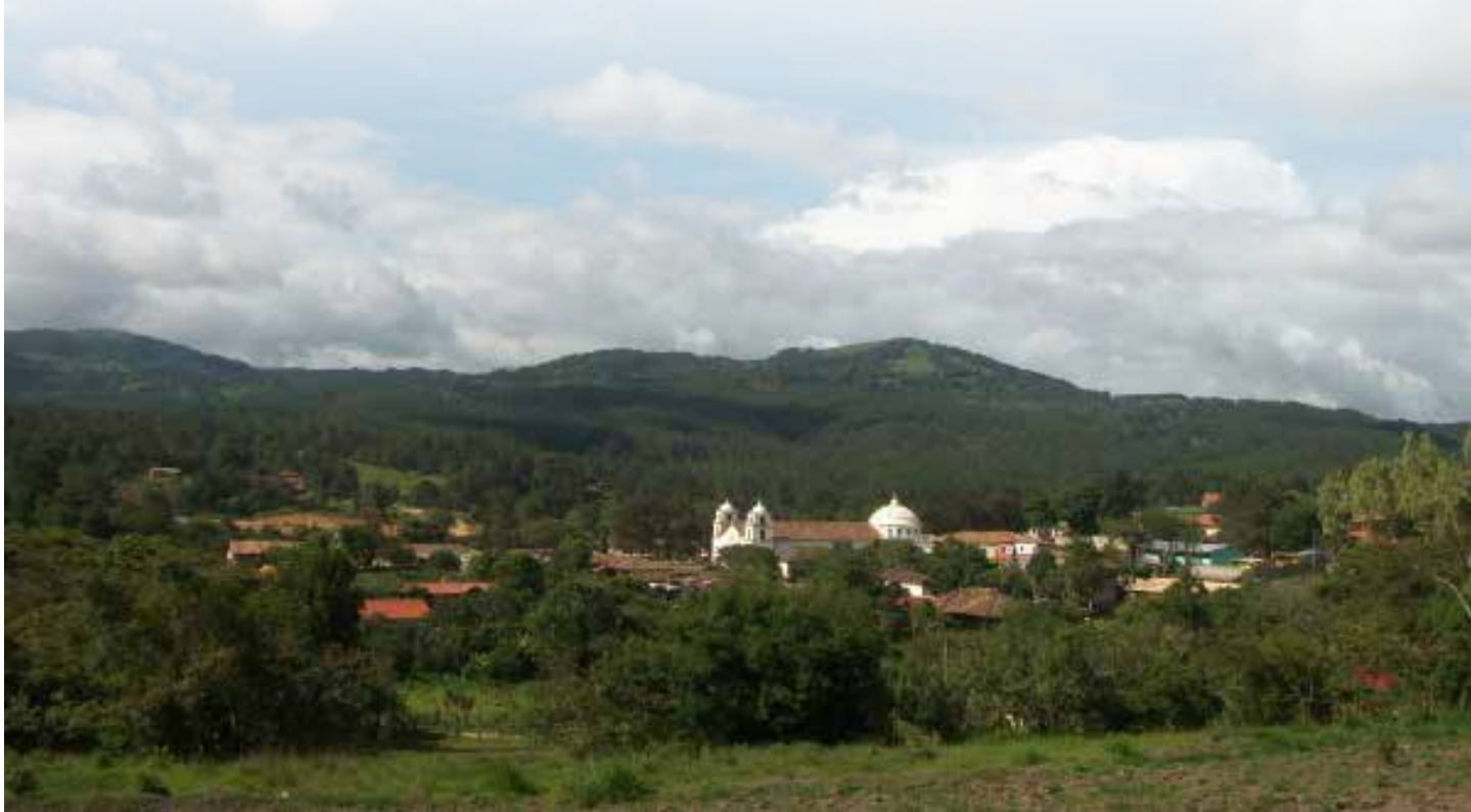
Panorámica de la comunidad de Yamaranguila, departamento de Intibucá.

Se espera que después de esta intervención se pueda mejorar la gestión del desarrollo en los municipios y se propicie en estos lugares las condiciones para lograr el cumplimiento de los derechos de la población más pobre y vulnerable del país y que los funcionarios municipales cuenten con herramientas que les permitan auto gestionar sus conocimientos.