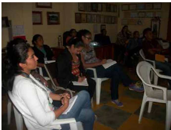
El personal de la alcaldía de Yamaranguila, Intibucá recibió el taller de planificación y presupuesto, tesorería, administración y catastro, entre otros.

Palabras Clave: Desarrollo local, Administración pública Gestión Capacidades locales