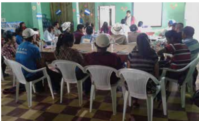
En una de las giras académica por parte del equipo de pedagogía, se capacitaron a 40 facilitadores, que posteriormente realizarán las jornadas de alfabetización en cada comunidad.

En la actualidad, se realizan diferentes giras académicas por parte de los estudiantes de la asignatura taller de práctica uniprofesional supervisada III, en las que se capacitan a los 40 facilitadores que posteriormente realizarán las jornadas de alfabetización en cada comunidad, dirigida a las personas adultas en el municipio de San Marcos de Sierra.