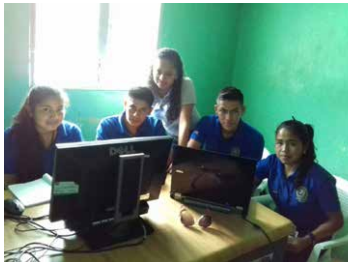
En San Marcos de Sierra los empleados de la comuna también recibieron un taller con duración de dos días.

rios y empleados de las corporaciones municipales de estas localidades.