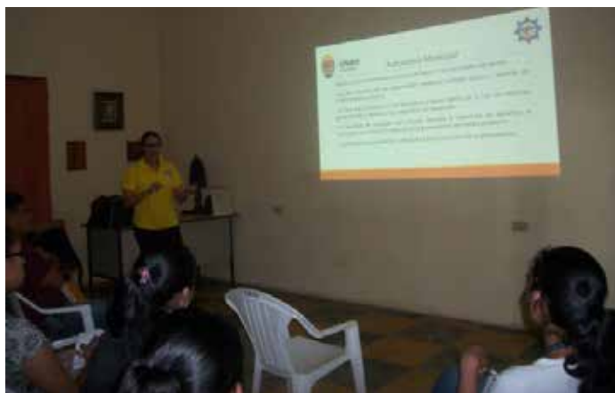
Profesores y estudiantes de la carrera de Administración Pública al momento de impartir el taller en Yamaranguila.

A finales del 2014, la UNAH priorizó un programa de desarrollo local que permitirá alcanzar mejores condiciones de vida en los habitantes de las comunidades identificadas en un espacio de 10 años.